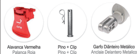
Alavanca Vermelha Palanca Roja