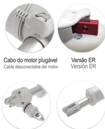
Cabo do motor plugável Cable desconnectable del motor