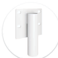
Suporte Branco Soporte Blanco