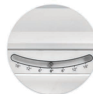
Indicador pernas com escala Indicador en piecero con escala