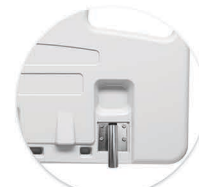
Suporte Zincado Soporte en Zinco