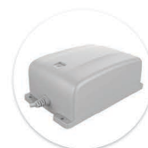
Bateria BP1 Bateria BP1