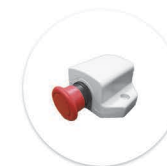
Botão de Emergência Boton de Emergencia

*Comandos manuais devem ser adquiridos separadamente. Mandos deben de ser adquiridos por separado.