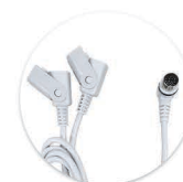
Cabo Y - DIN 13 Cable Y - DIN 13