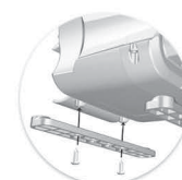
Pés de fixação MC 15 / MC 17 DB Pies de fijación MC 15 / MC 17 DB