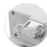
Cabo de Alimentação Plugável Cable de Alimentación Plugable