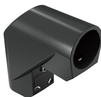
Conexão fixa de 90° Conexión fija de 90°