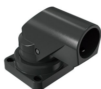
Suporte topo horizontal articulado Soporte topo horizontal articulado