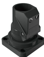
Suporte base articulado Soporte base articulado