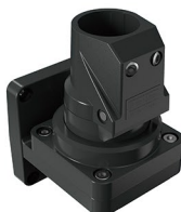
Suporte parede vertical articulado Soporte pared vertical articulado