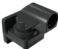
Suporte parede horizontal articulado Soporte pared horizontal articulado