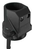
Acoplamento tubo/painel 180° com flange articulado Acoplamiento tubo/panel 180° con empalme articulado