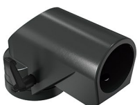
Acoplamento tubo/painel 90° com flange articulado Acoplamiento tubo/panel 90° con empalme articulado