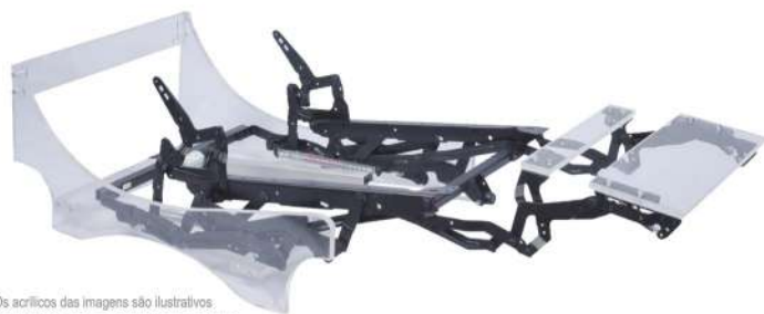
*Os acrílicos das imagens são ilustrativos. *Los acrílicos en las imágenes son ilustrativos.