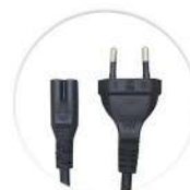
Cabo de Alimentação BR Cable del Alimentación BR