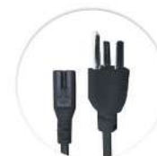
Cabo de Alimentação USA Cable del Alimentación USA