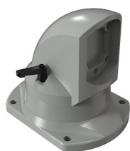
Suporte topo horizontal articulado Soporte tope horizontal articulado