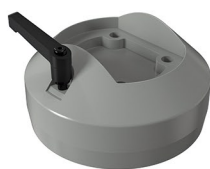
Acoplamento perfil/painel 180° articulado Acoplamiento perfil/panel 180° articulado