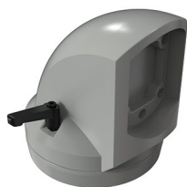
Acoplamento perfil/painel 90° articulado Acoplamiento perfil/panel 90° articulado