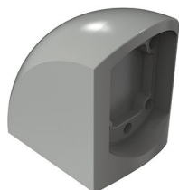
Conexão fixa de 90° Conexión fija de 90°