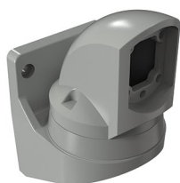
Suporte parede horizontal articulado Soporte pared horizontal articulado